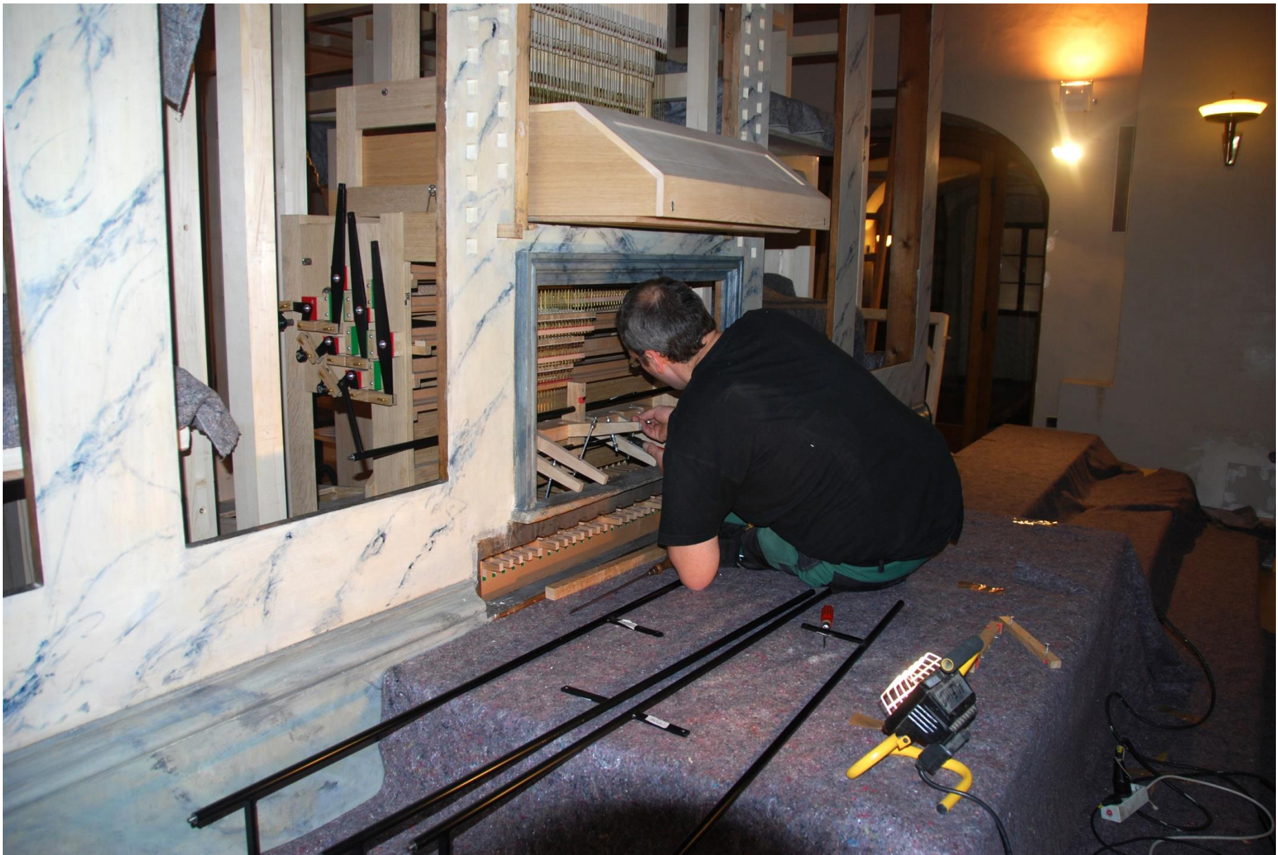
Probíhá montáž hracího stolu.