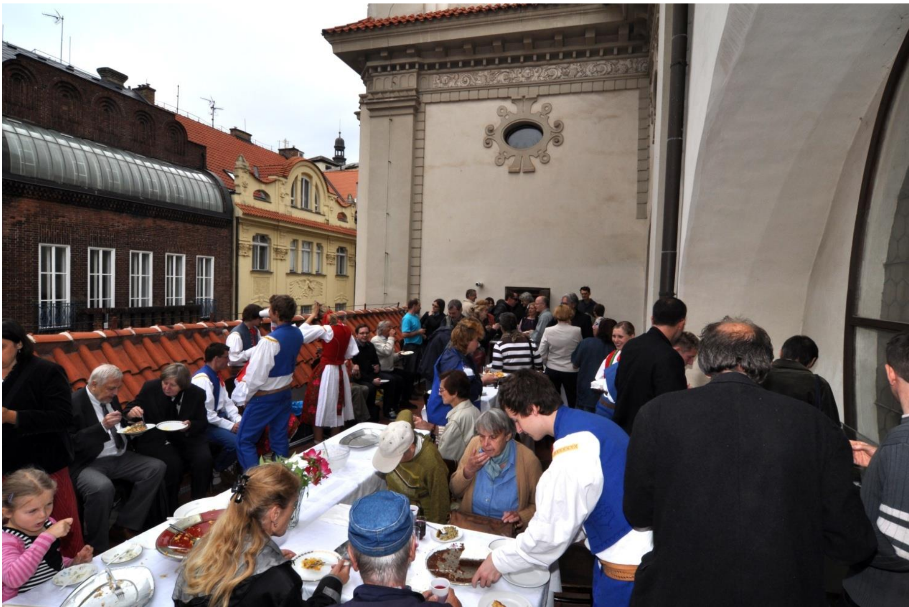
Slavnostní otevření renovovaných chrámových teras.