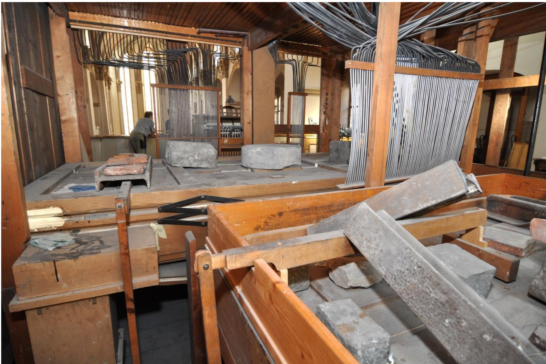
Pohled do částečně rozebraného starého varhanního stroje.