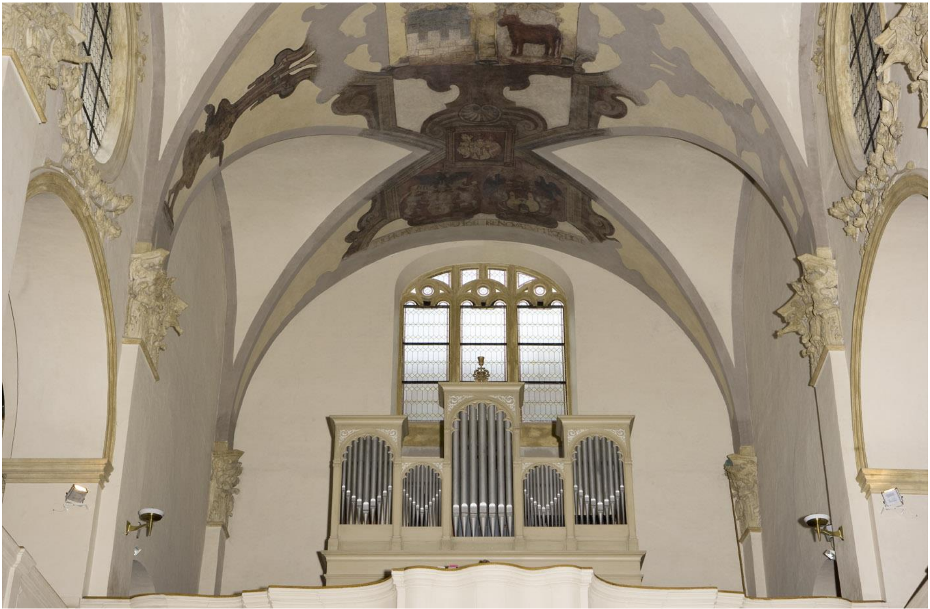
Pohled na chrámovou kruchtu před rekonstrukcí.