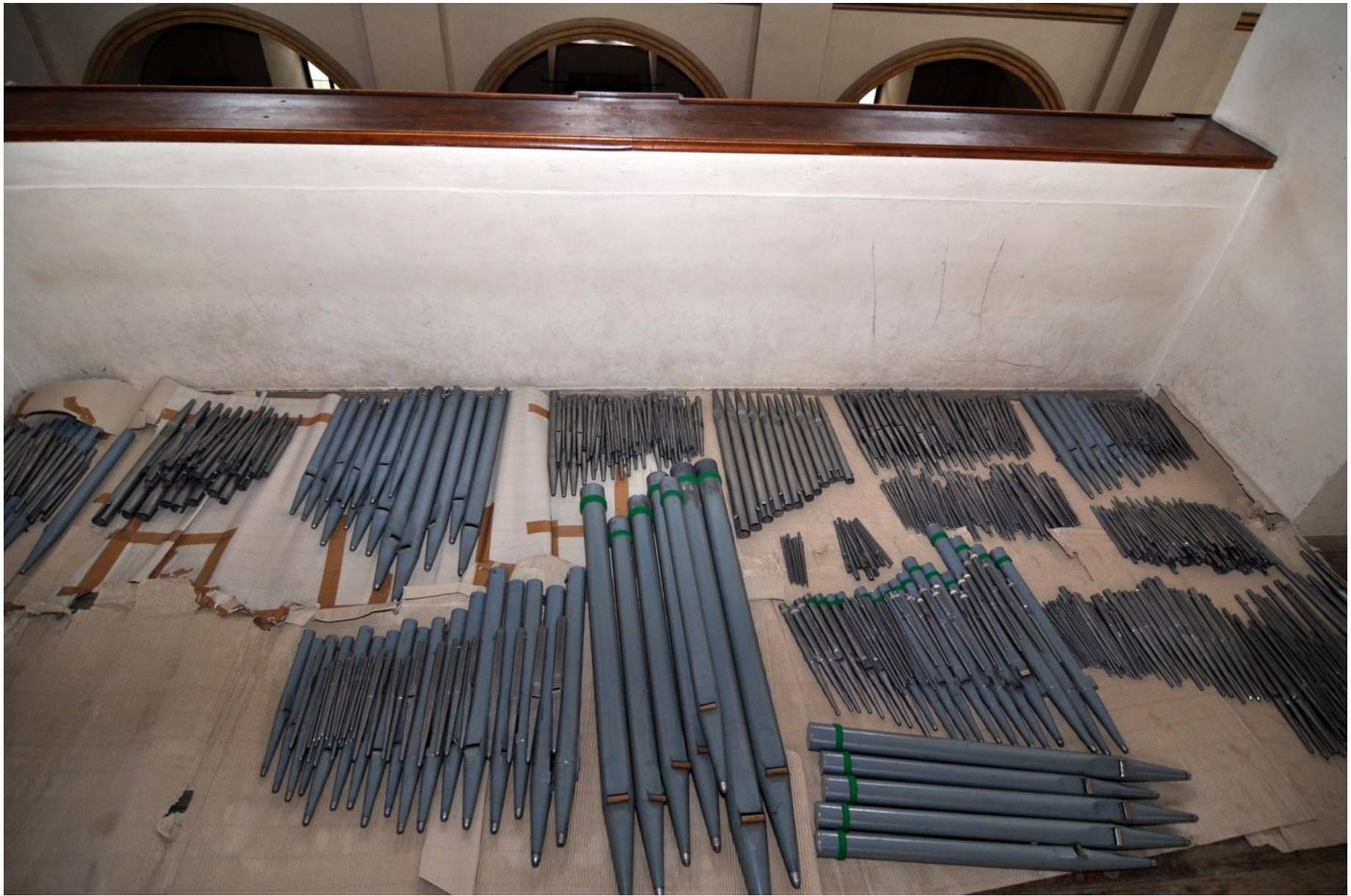
Staré píšťaly srovnané na kůru.