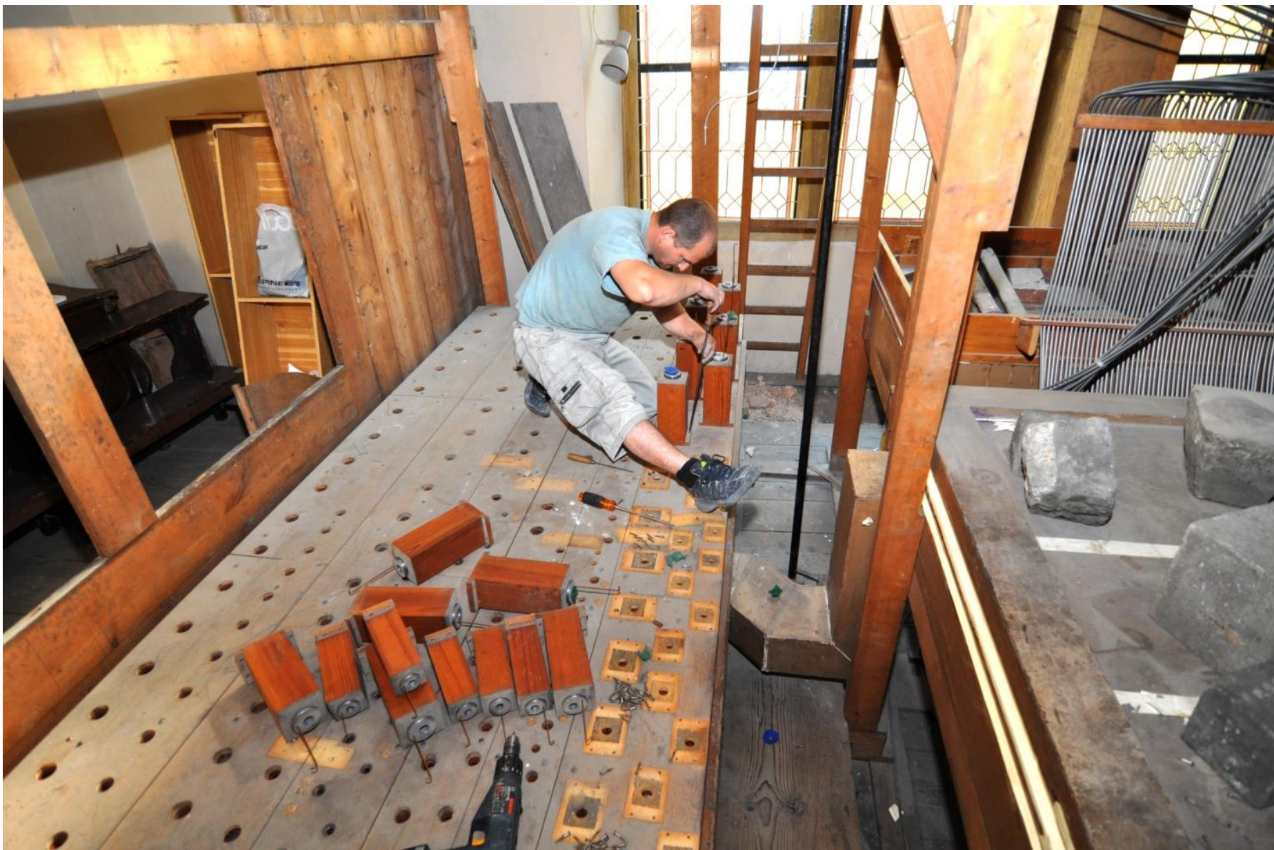
Demontáž starého varhanního stroje.