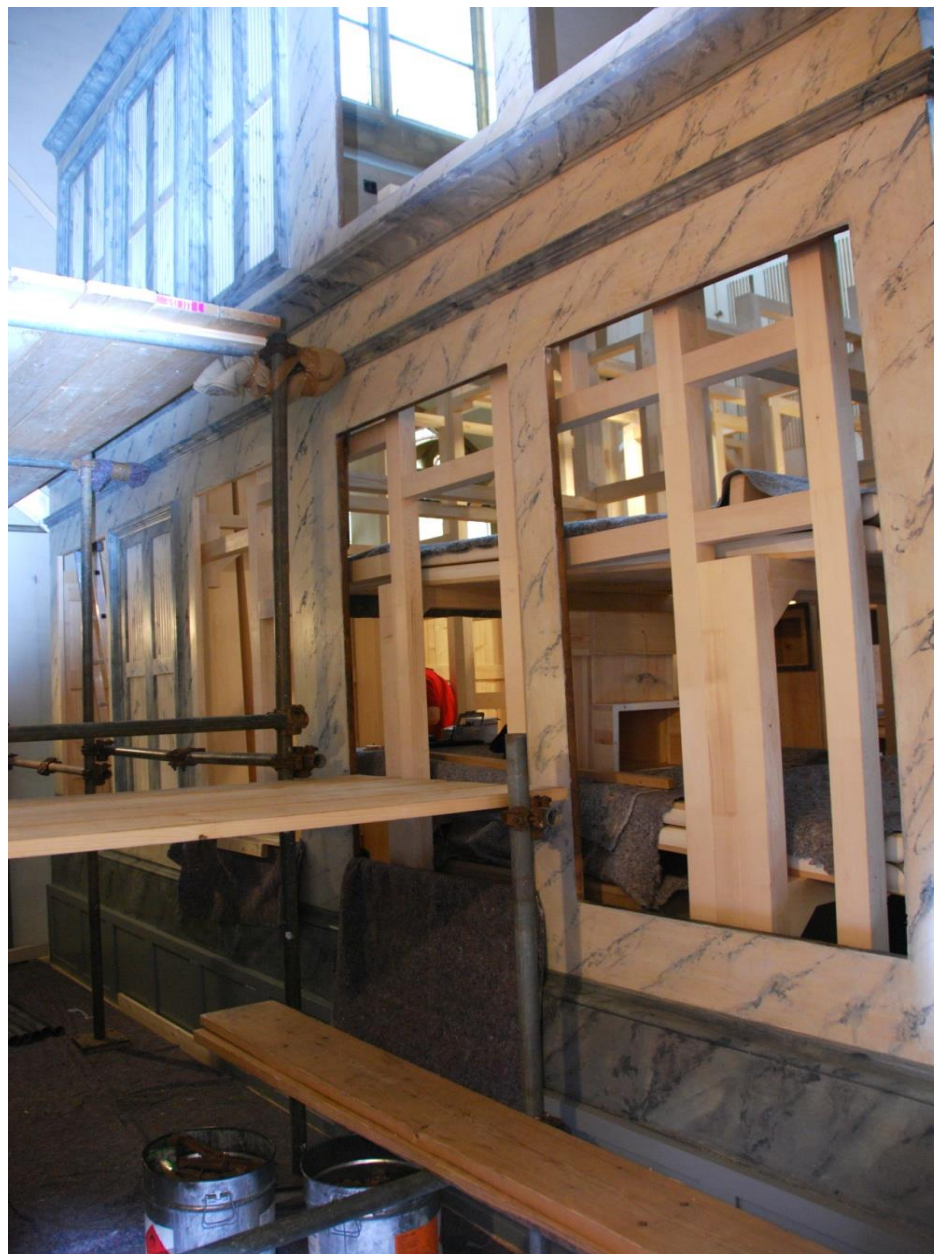
Vestavba nového stroje do restaurované skříně.