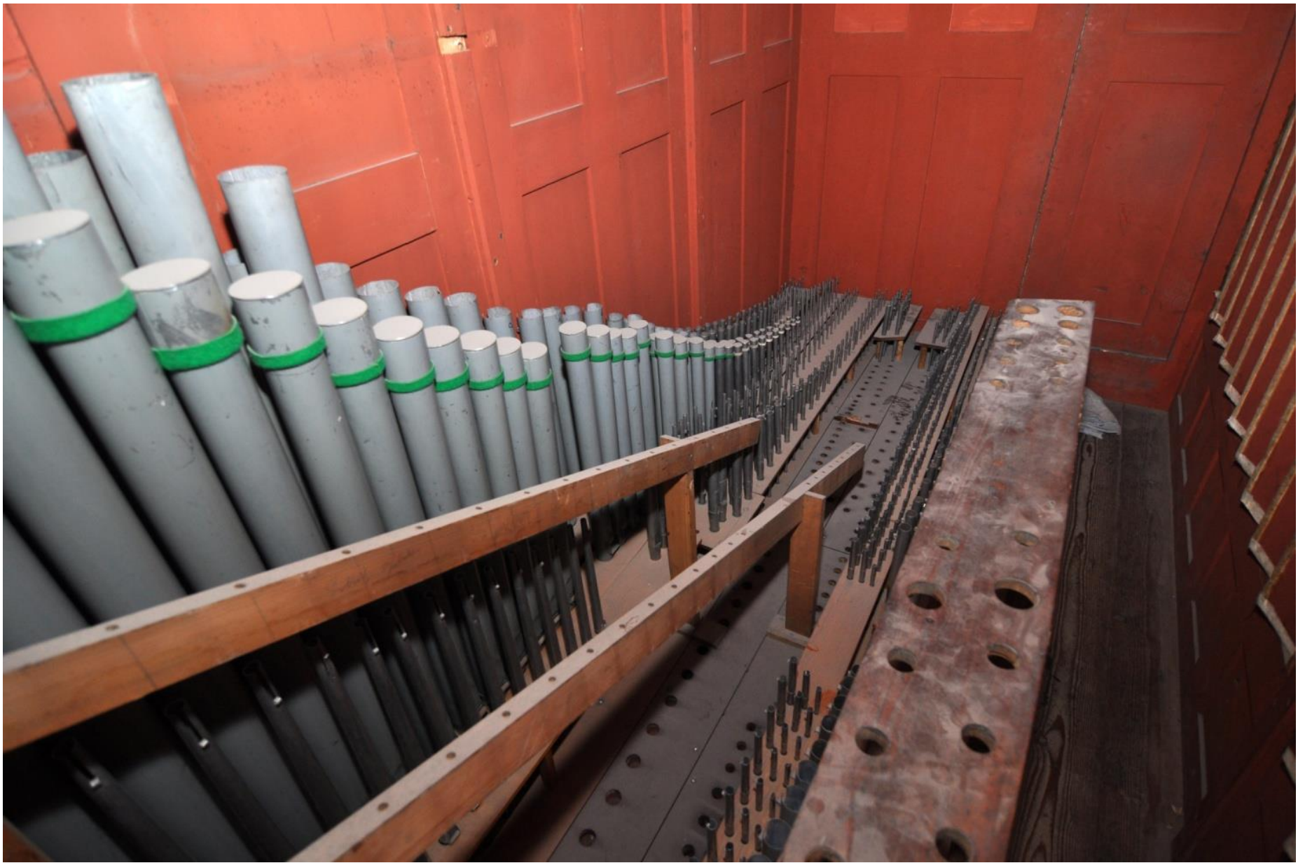
Pohled do nitra demontovaného stroje.