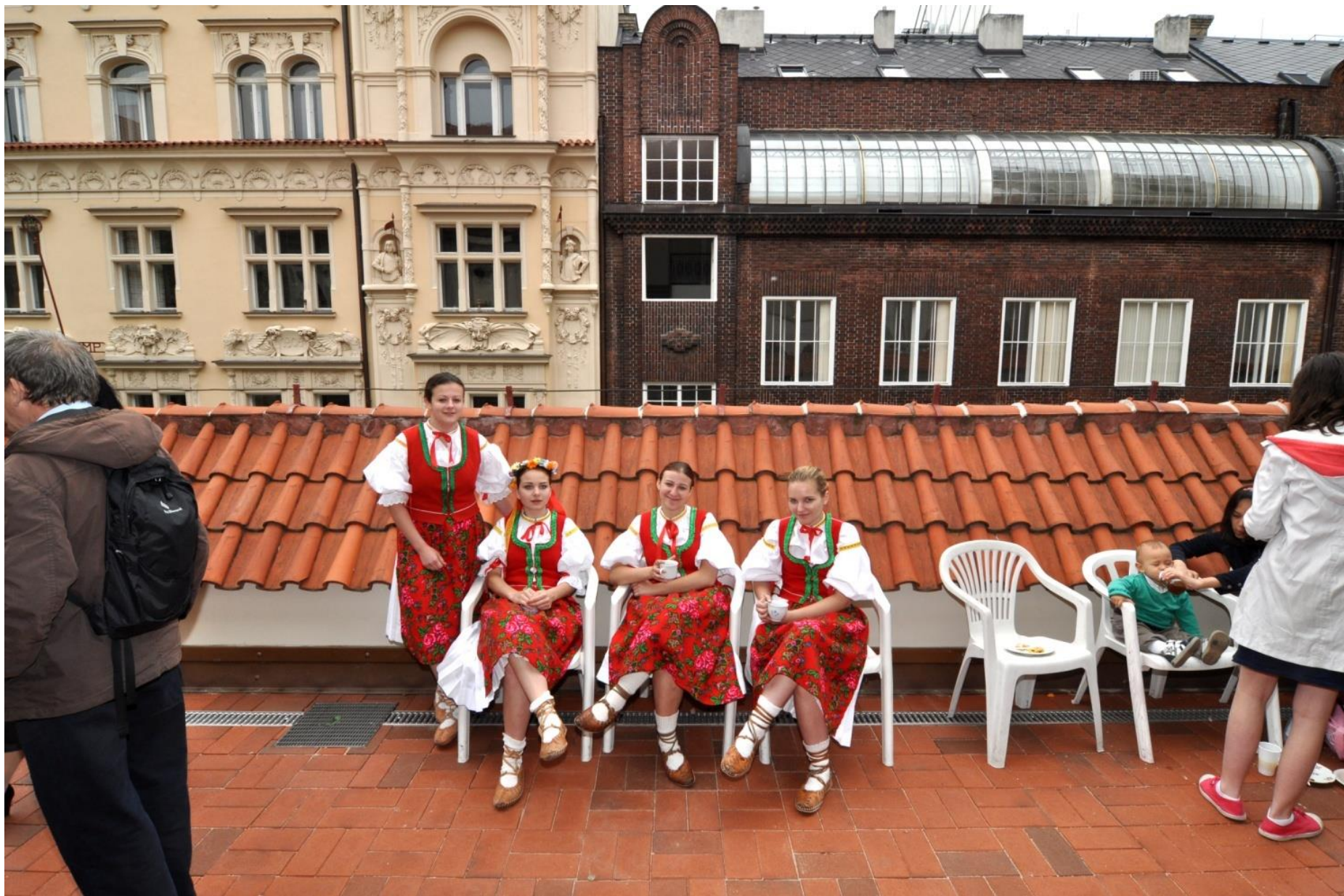
Slavnostní otevření renovovaných chrámových teras.