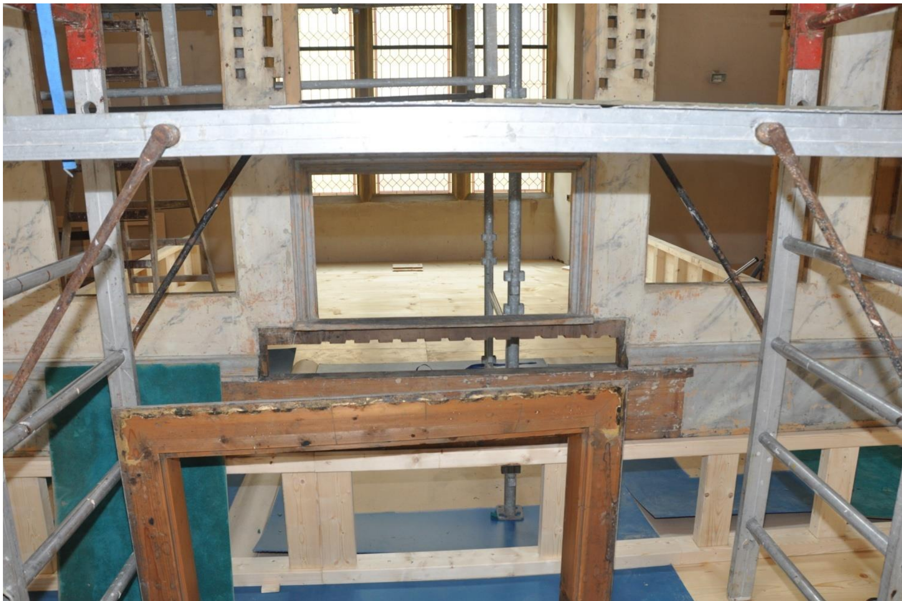
Nově postavená varhanní skříň, detail otvoru pro hrací stůl.