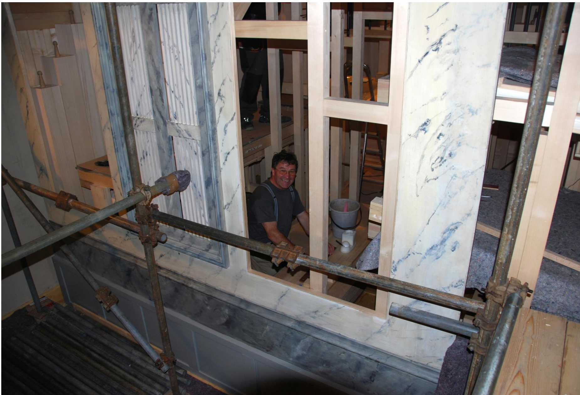
Probíhá lepení vzdušnic.