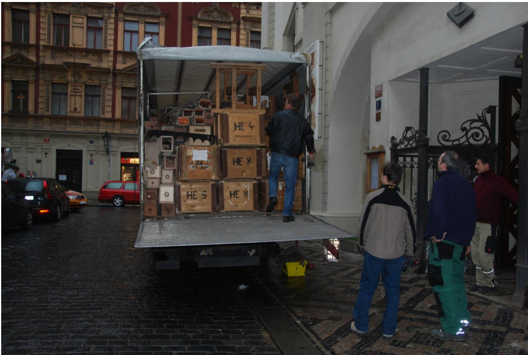
Varhany přivezeny od dodavatele z Bautzen.