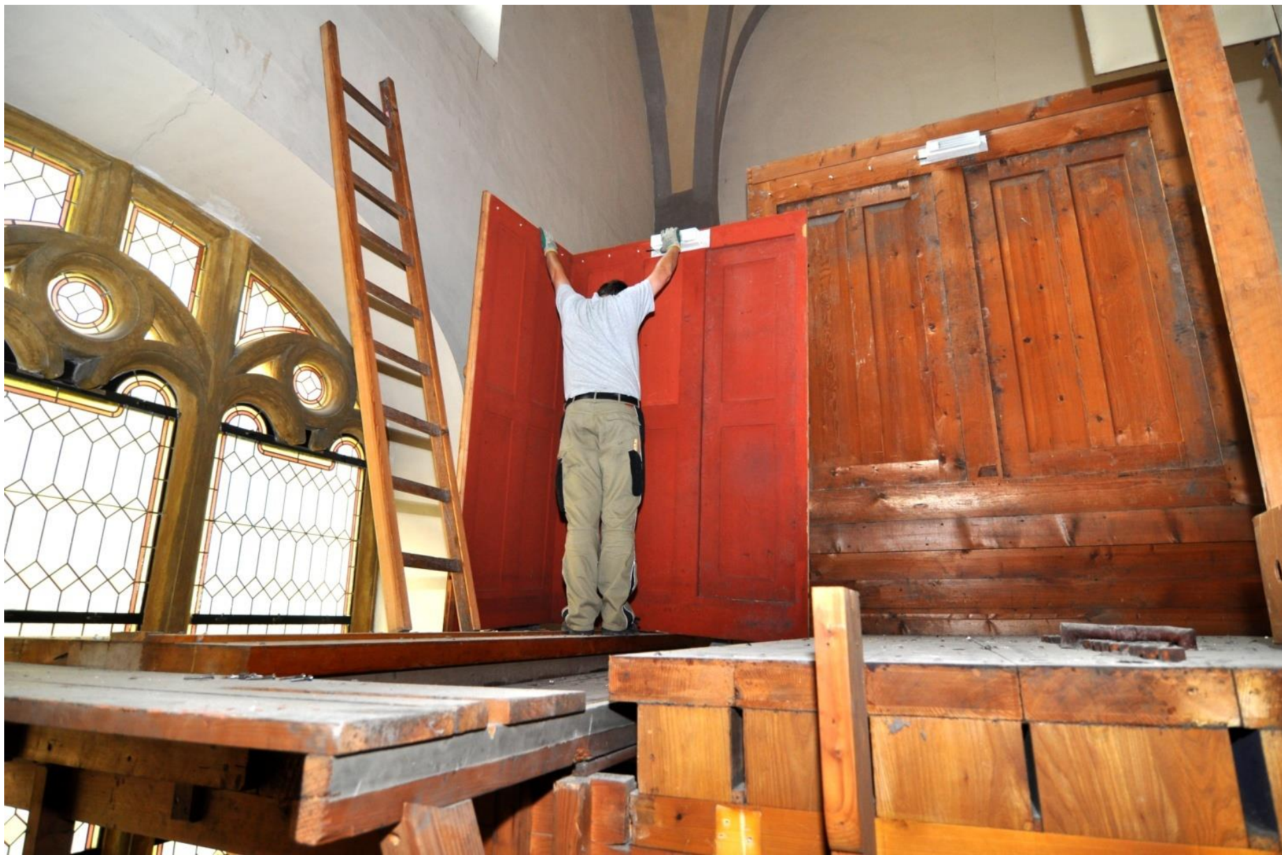
Demontáž varhanní skříně – příprava na restaurování.