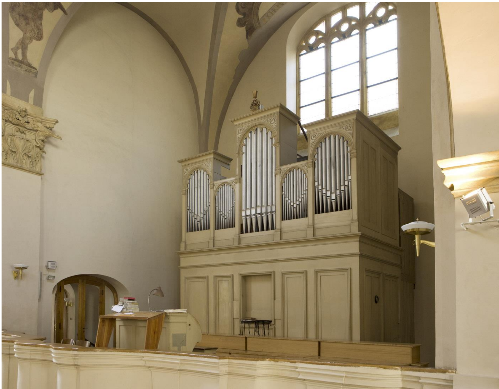
Pohled na kruchtu z bočního kůru před rekonstrukcí.