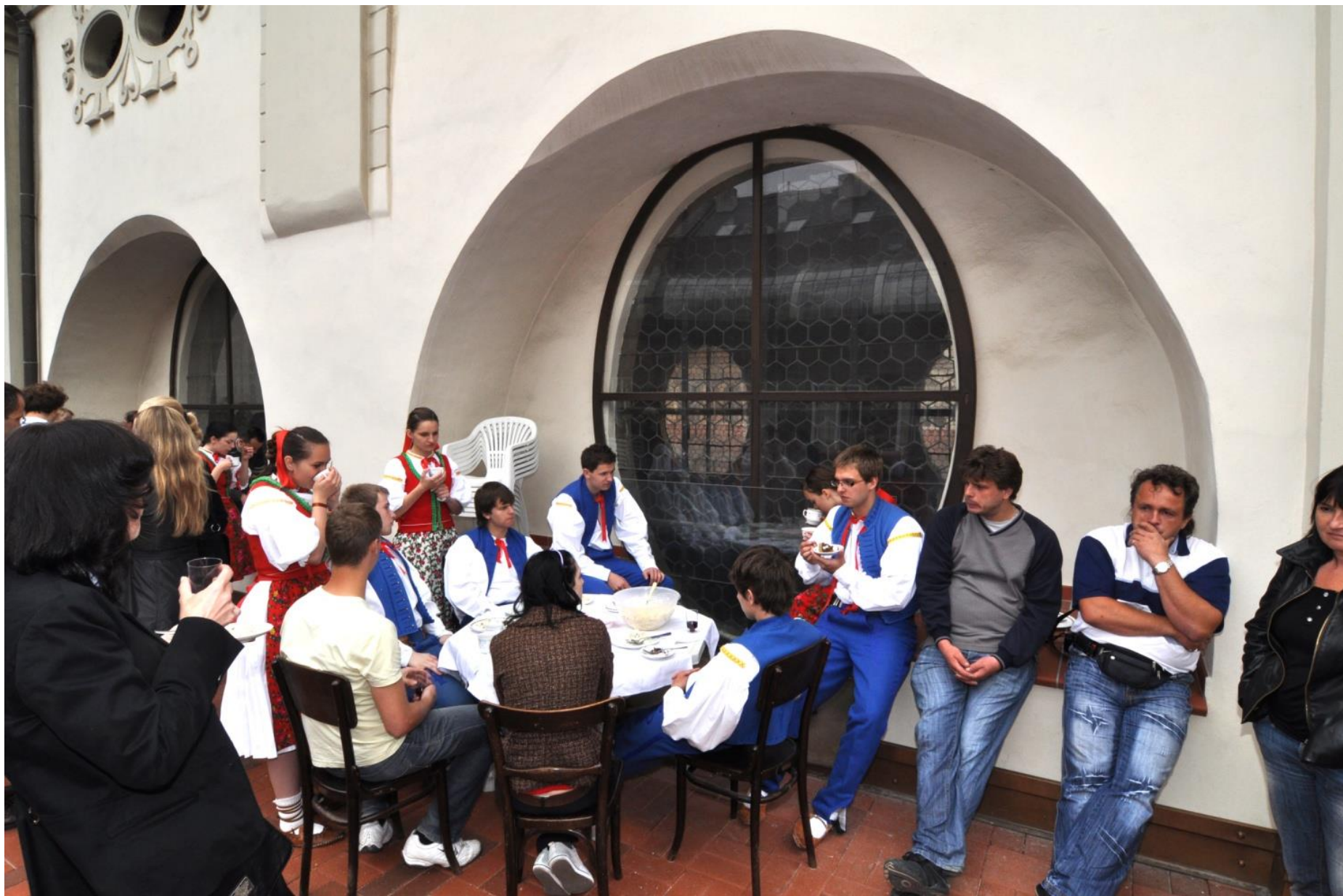
Slavnostní otevření renovovaných chrámových teras.