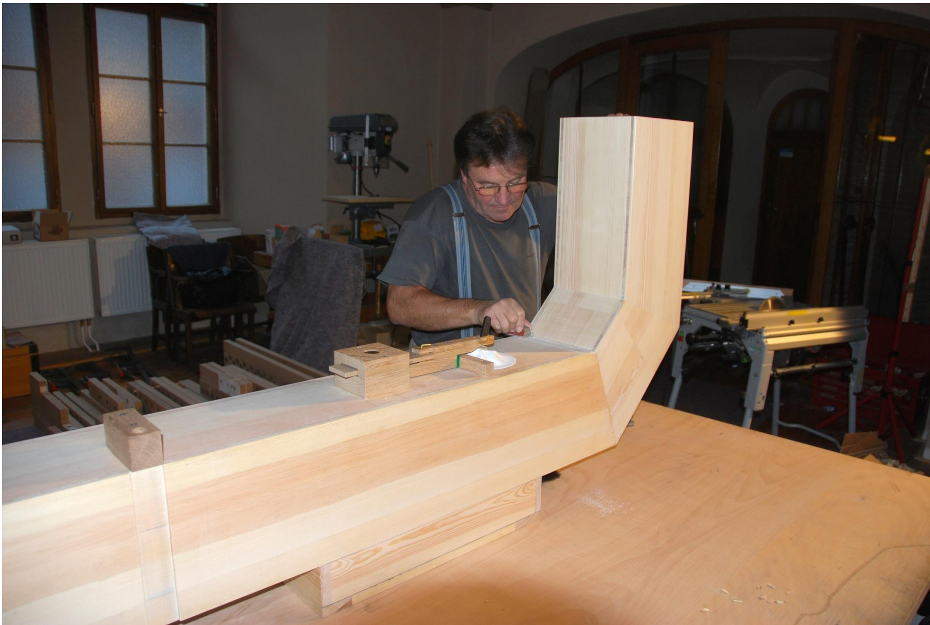
Příprava vzdušnic pro vedení tlakového vzduchu.