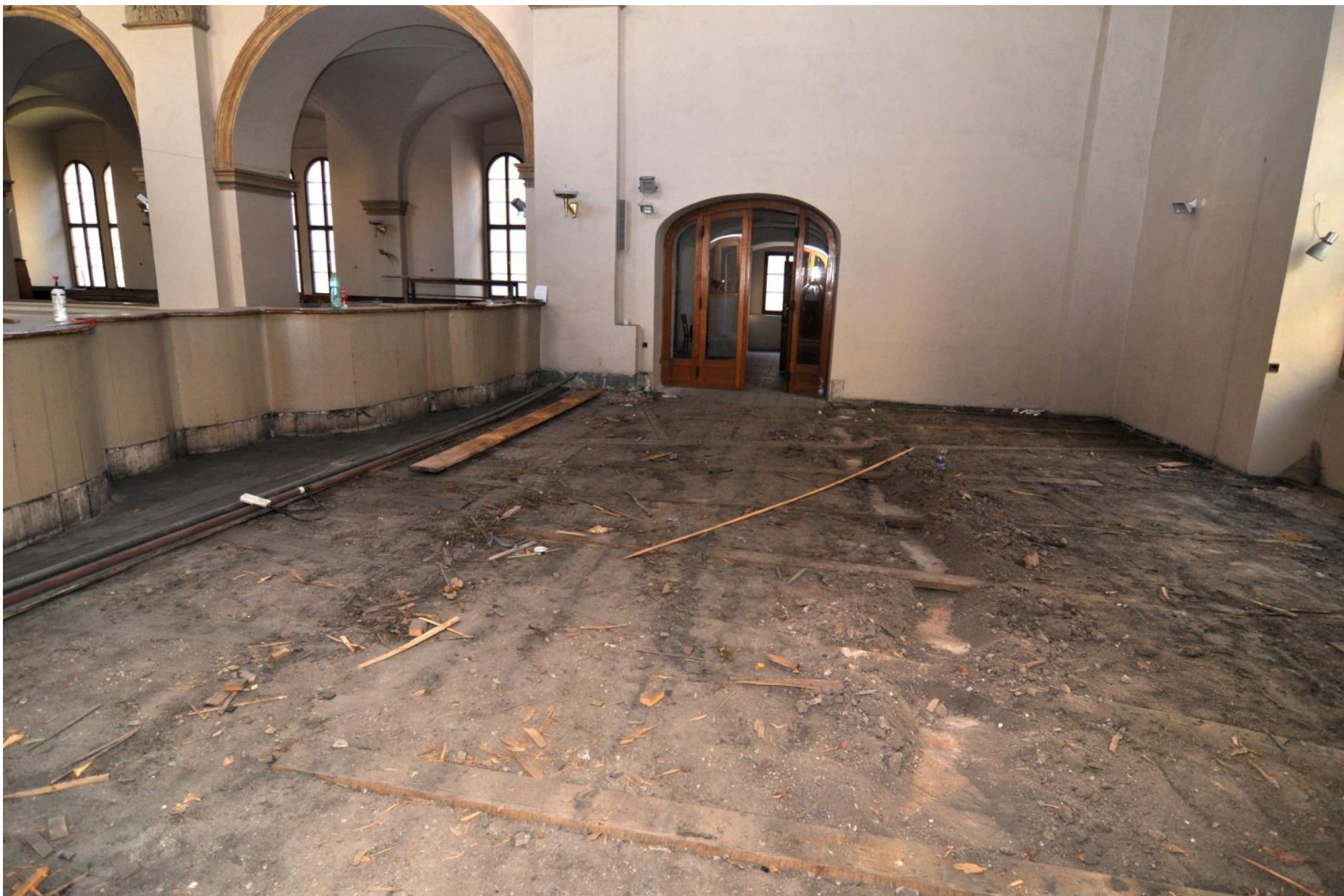
Opravy podlah na kruchtě.