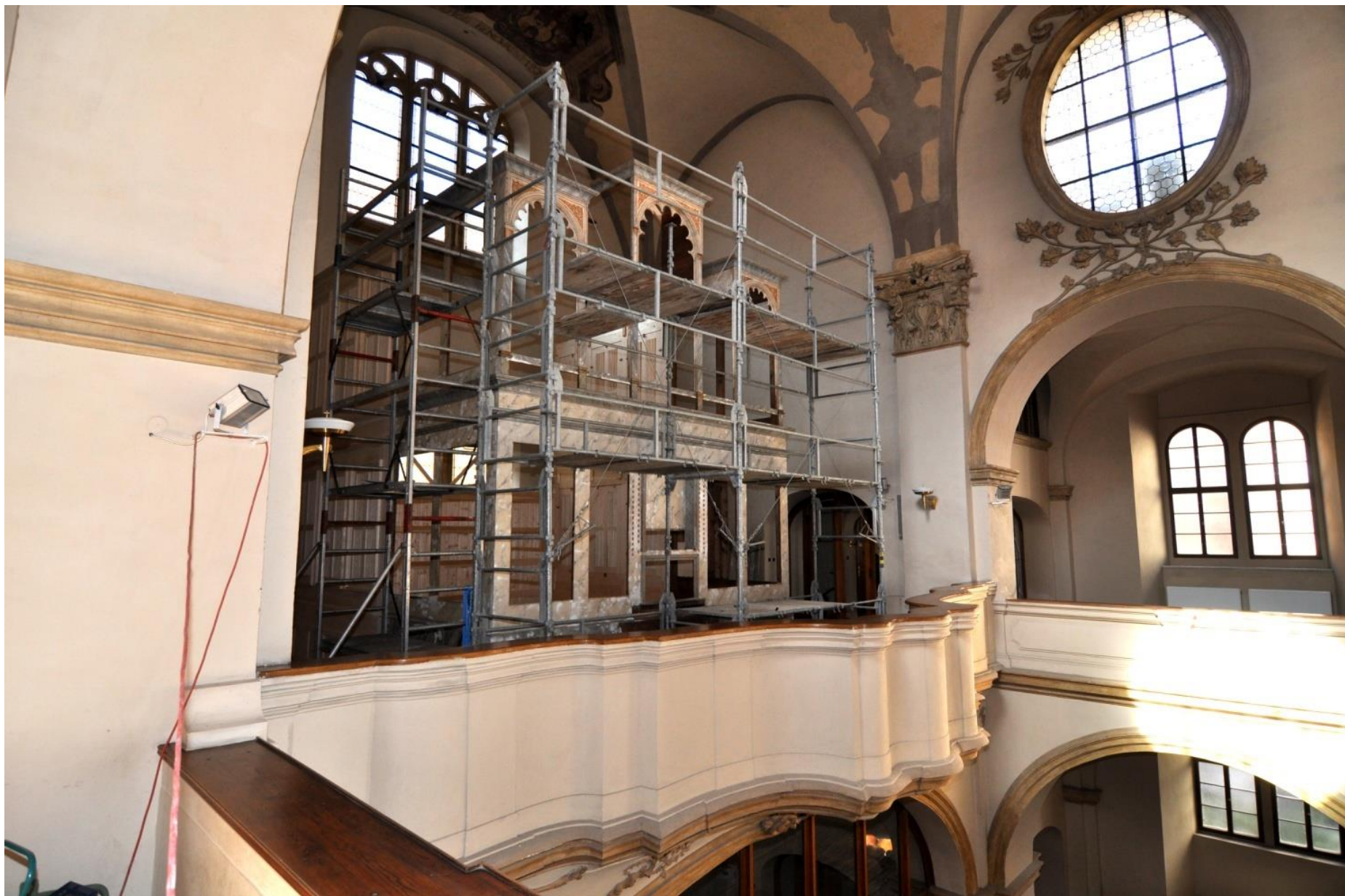
Stavba restaurované varhanní skříně.