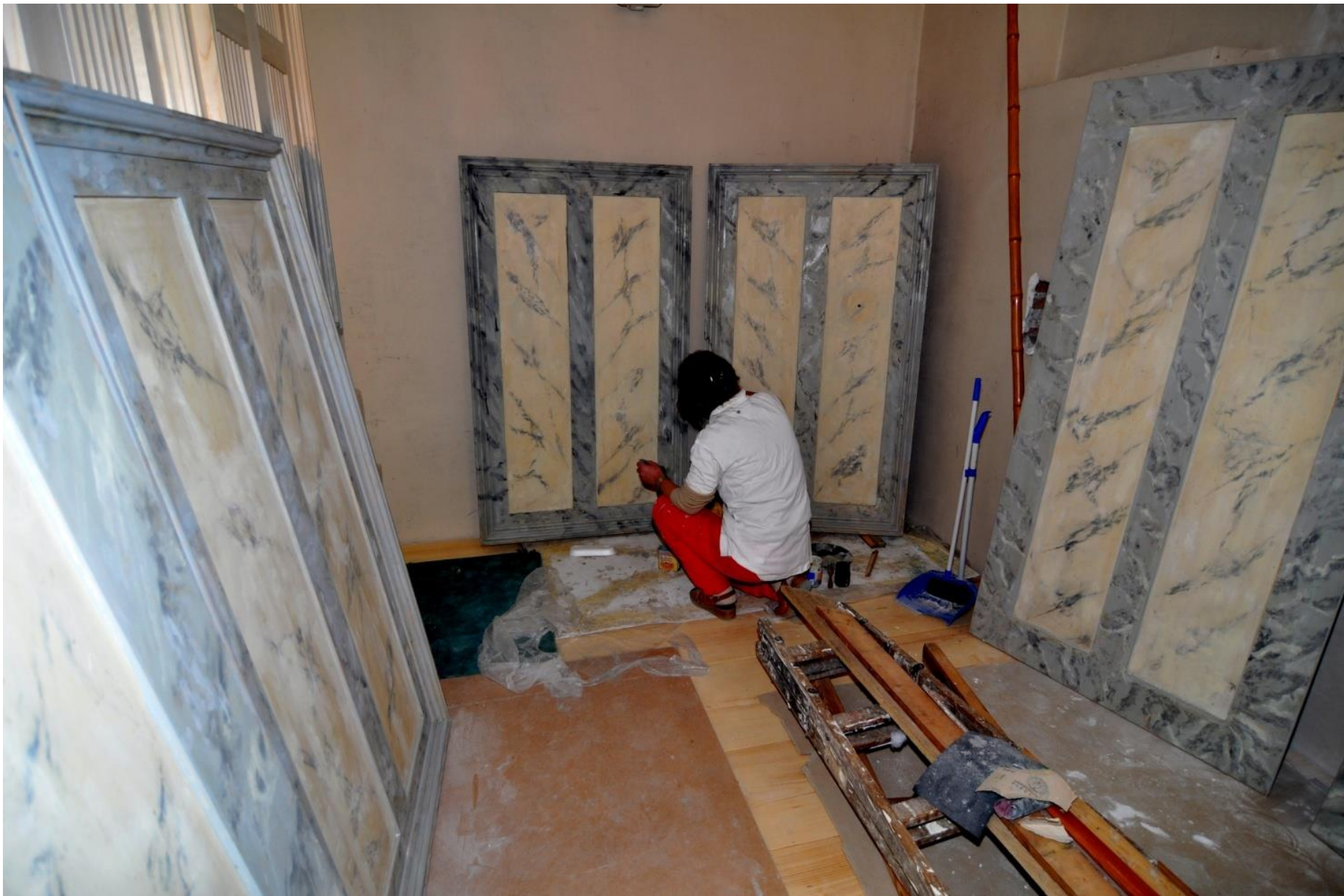
Restaurování varhanní skříně.