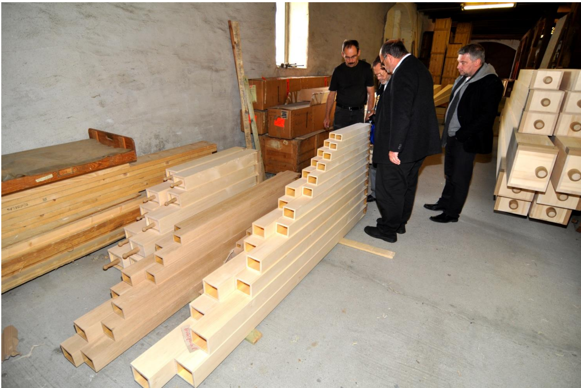
Kontrolní den v Bautzen – nový rejstřík Prinzipal