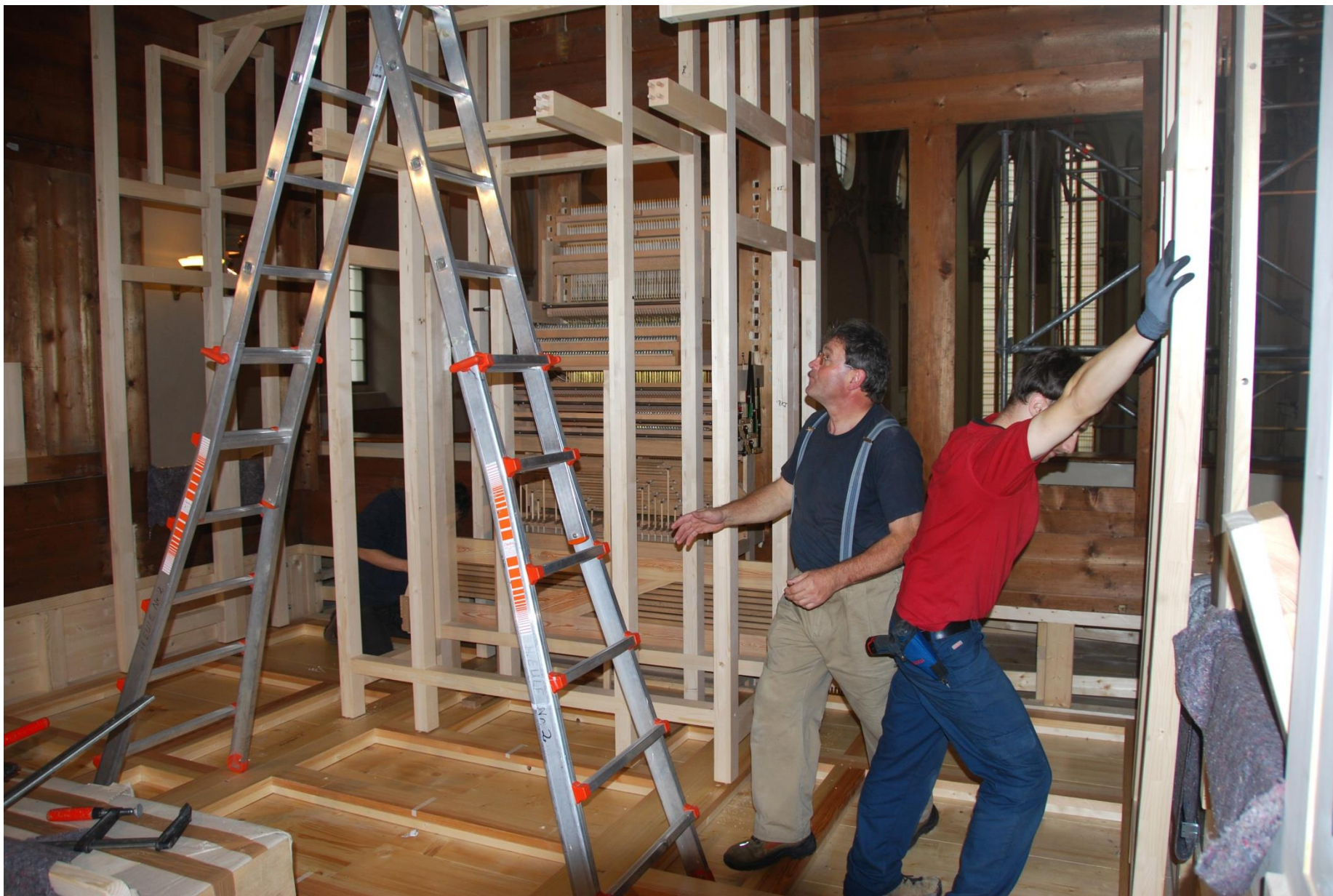
Vestavba nového varhanného stroje.