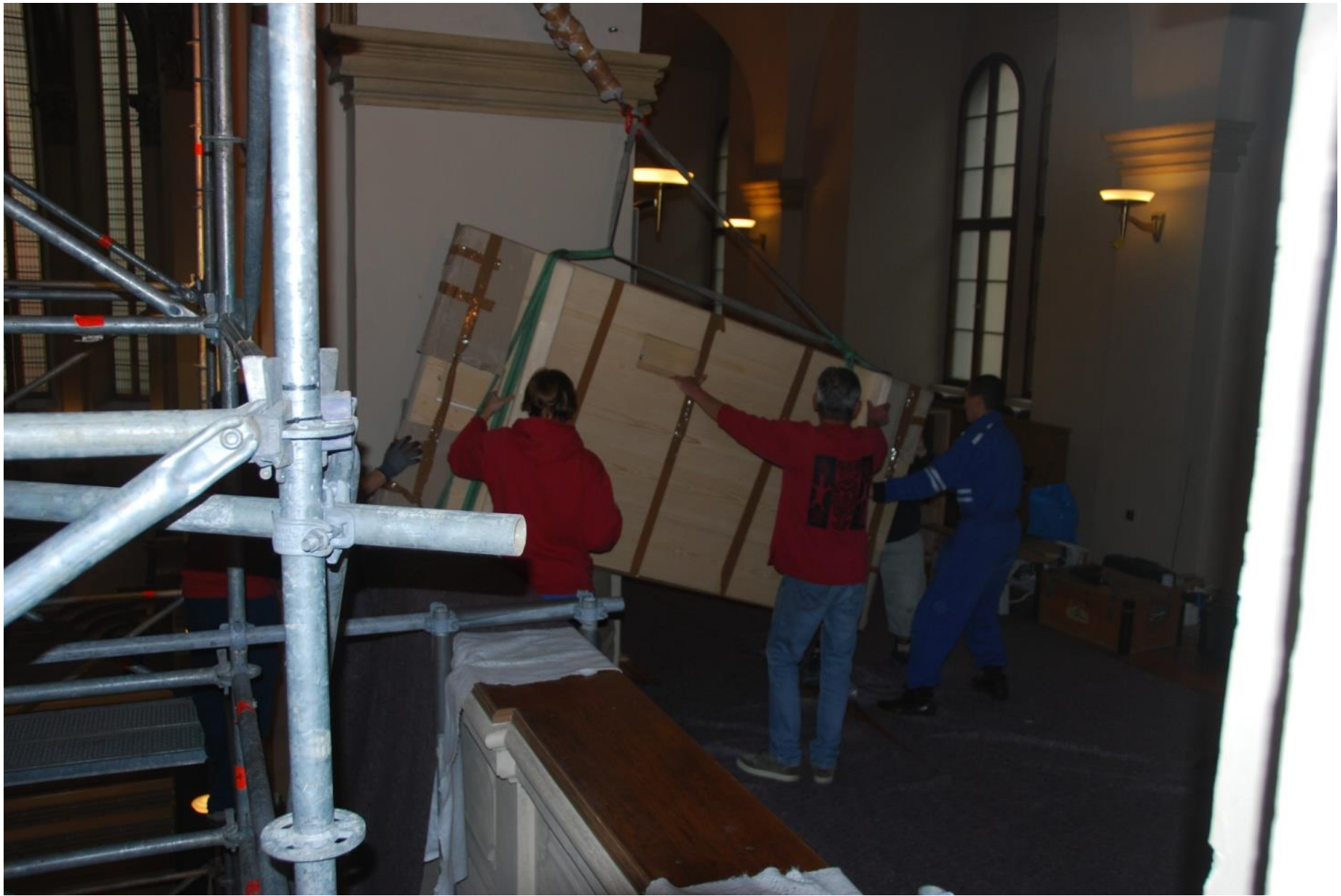
Transport velkých kusů.