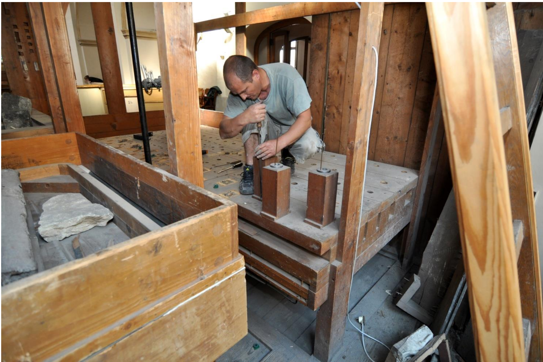
Demontáž varhanního stroje.