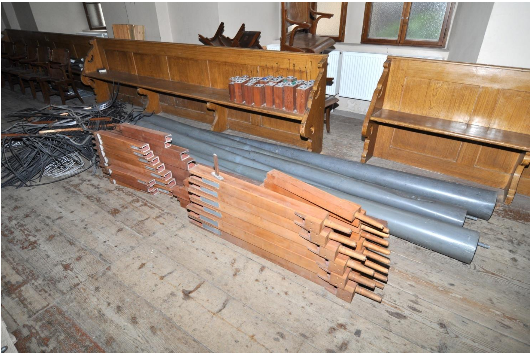
Staré píšťaly srovnané na kůru.