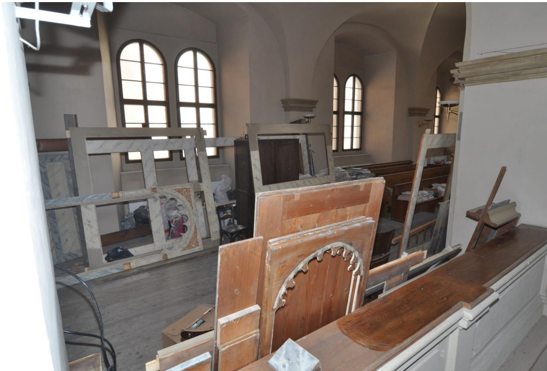
Rozebraná stará varhanní skříň, připravená k restaurování.