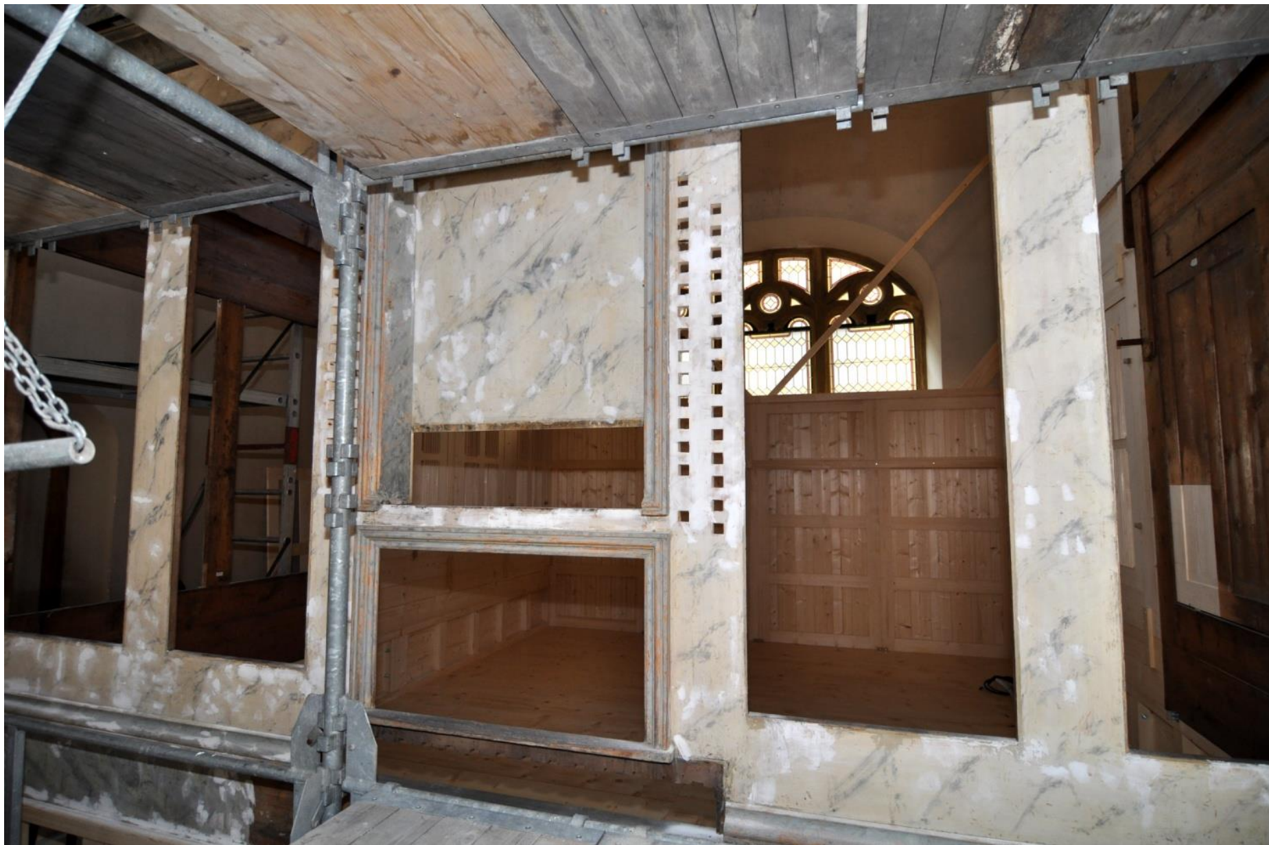
Restaurování varhanní skříně, otvor pro hrací stůl.