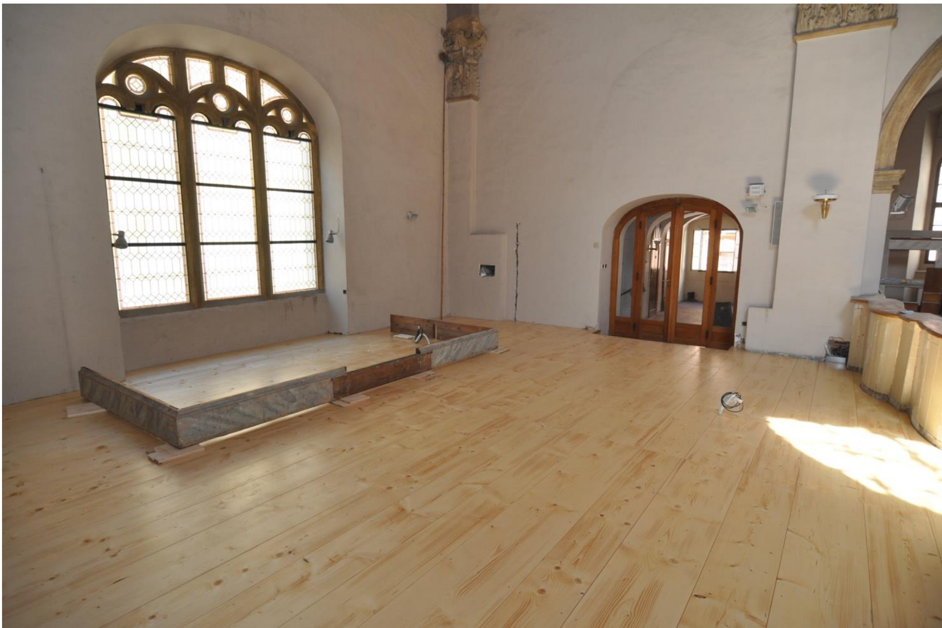
Nová podlaha na kruchtě.