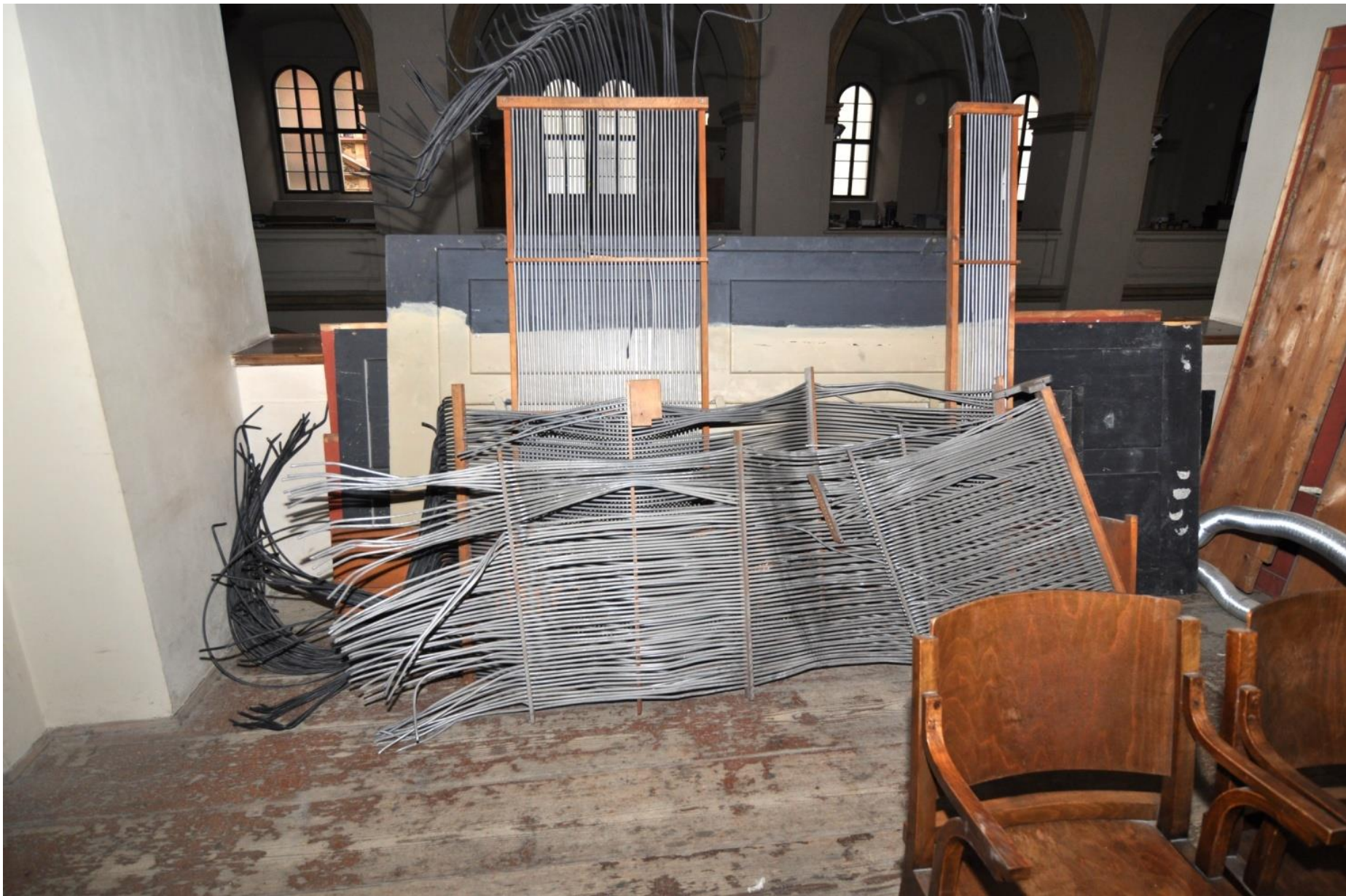
Rozebrané části pneumatického ovládání.