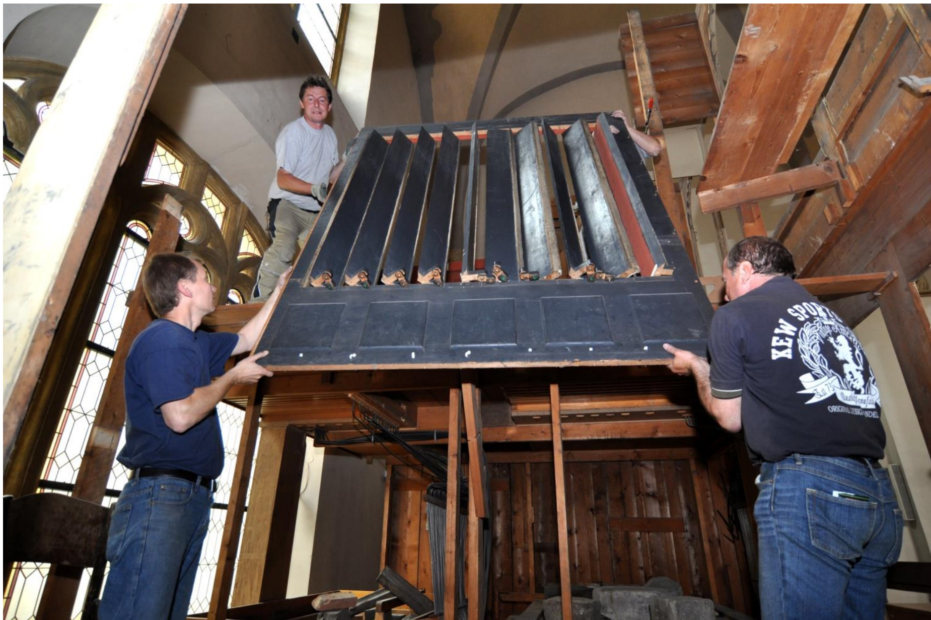
Demontáž starého varhanního stroje.