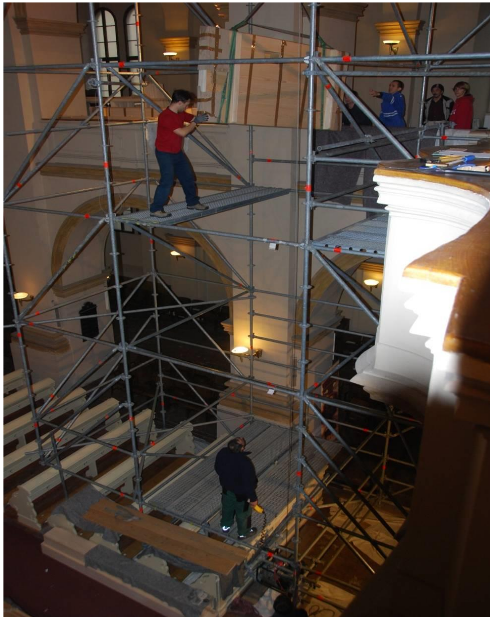
Transport velkých dílů střední chrámovou lodí.