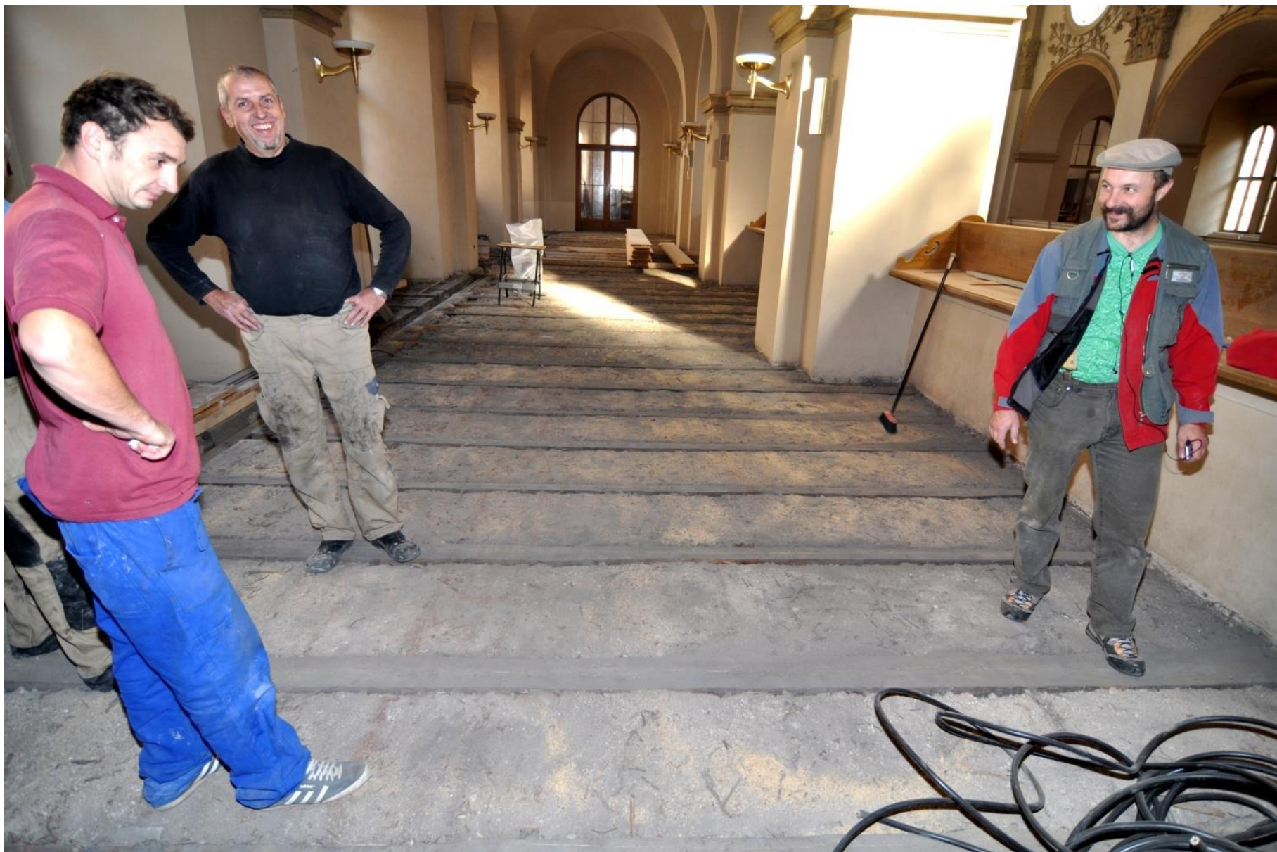
Oprava podlah na kůru.