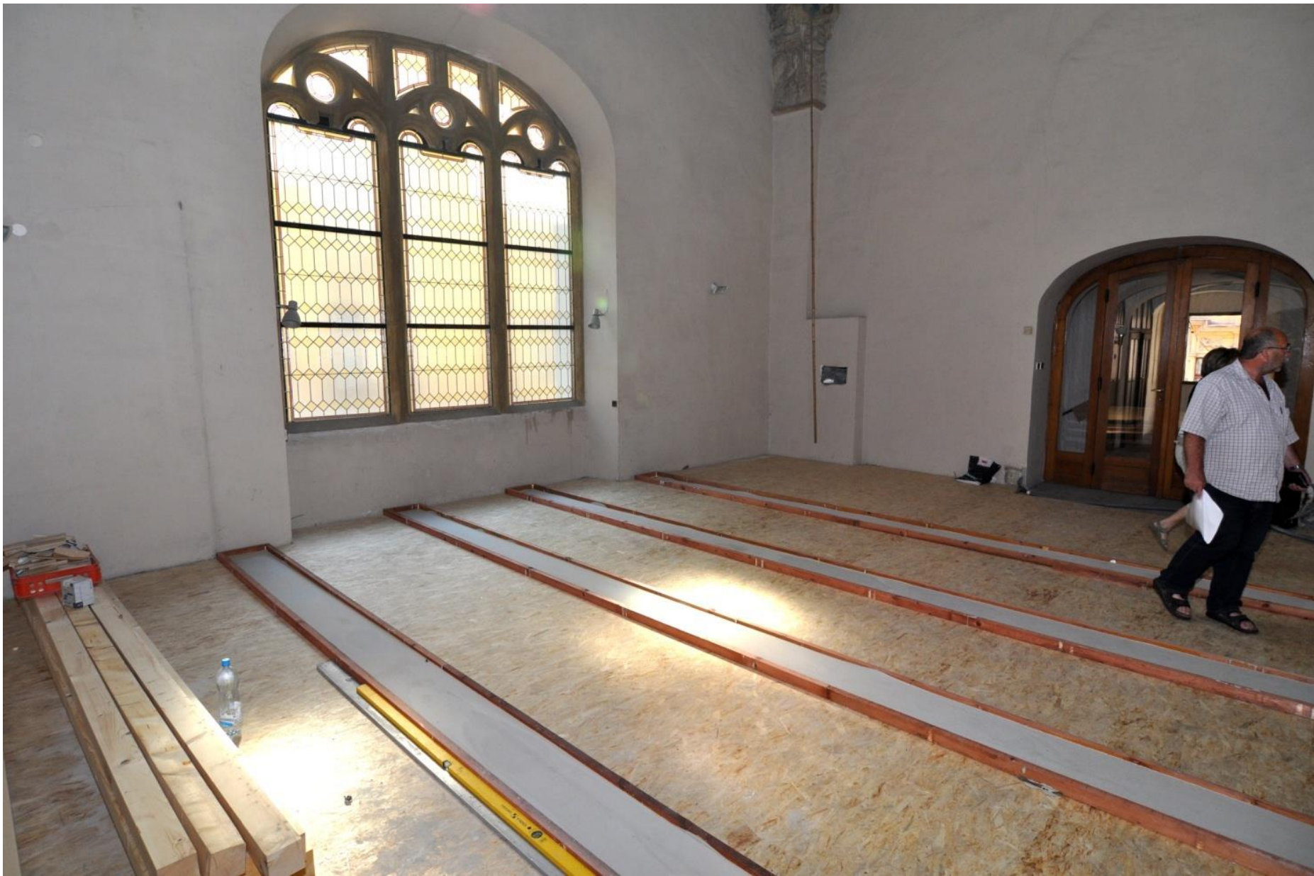
Opravy oprav na kruchtě.