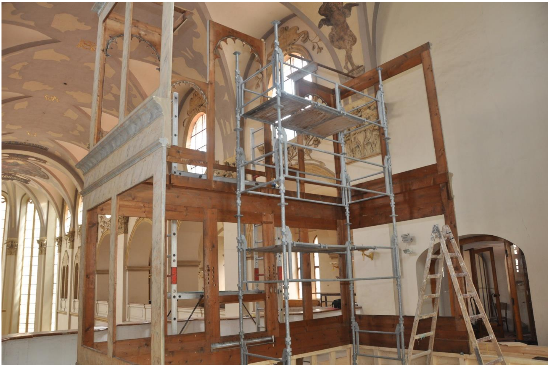
Stavba restaurované varhanní skříně.