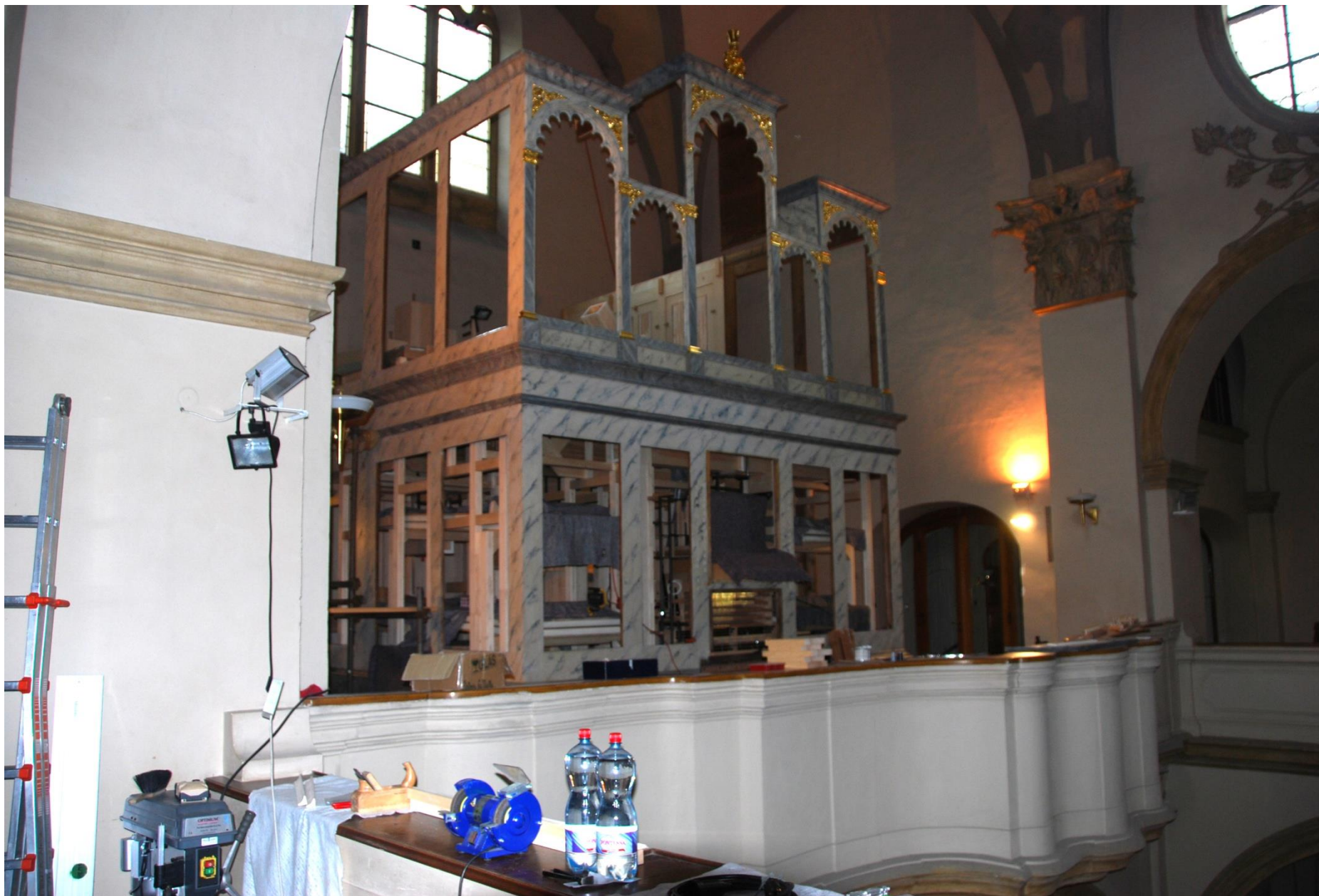
Pohled na montáž z kůru.