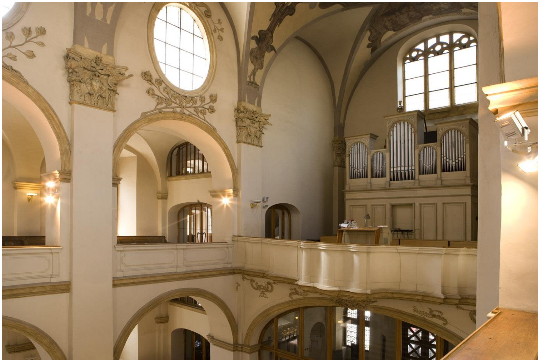
Pohled na kruchtu z bočního kůru před rekonstrukcí.