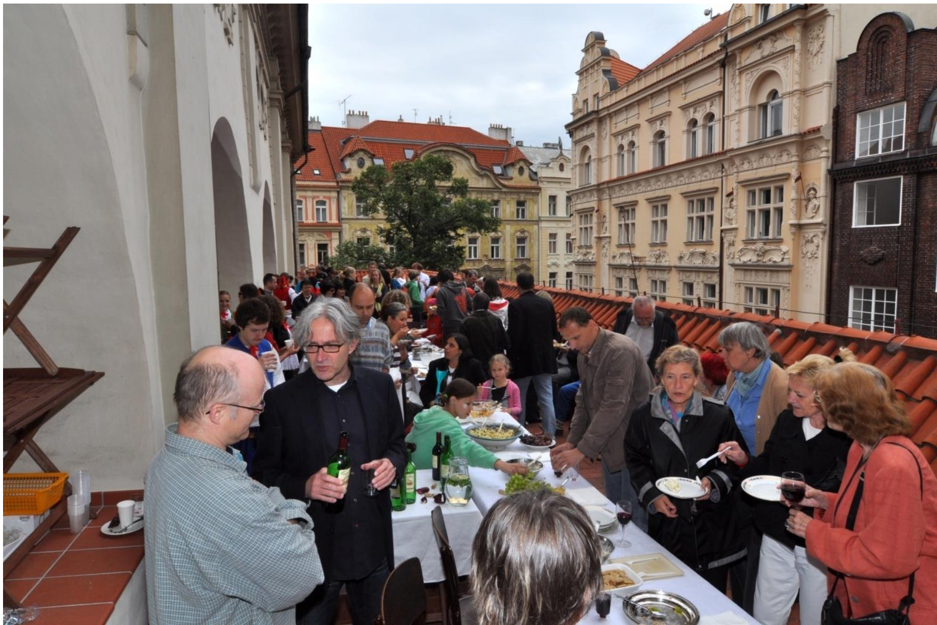
Slavnostní otevření renovovaných chrámových teras.