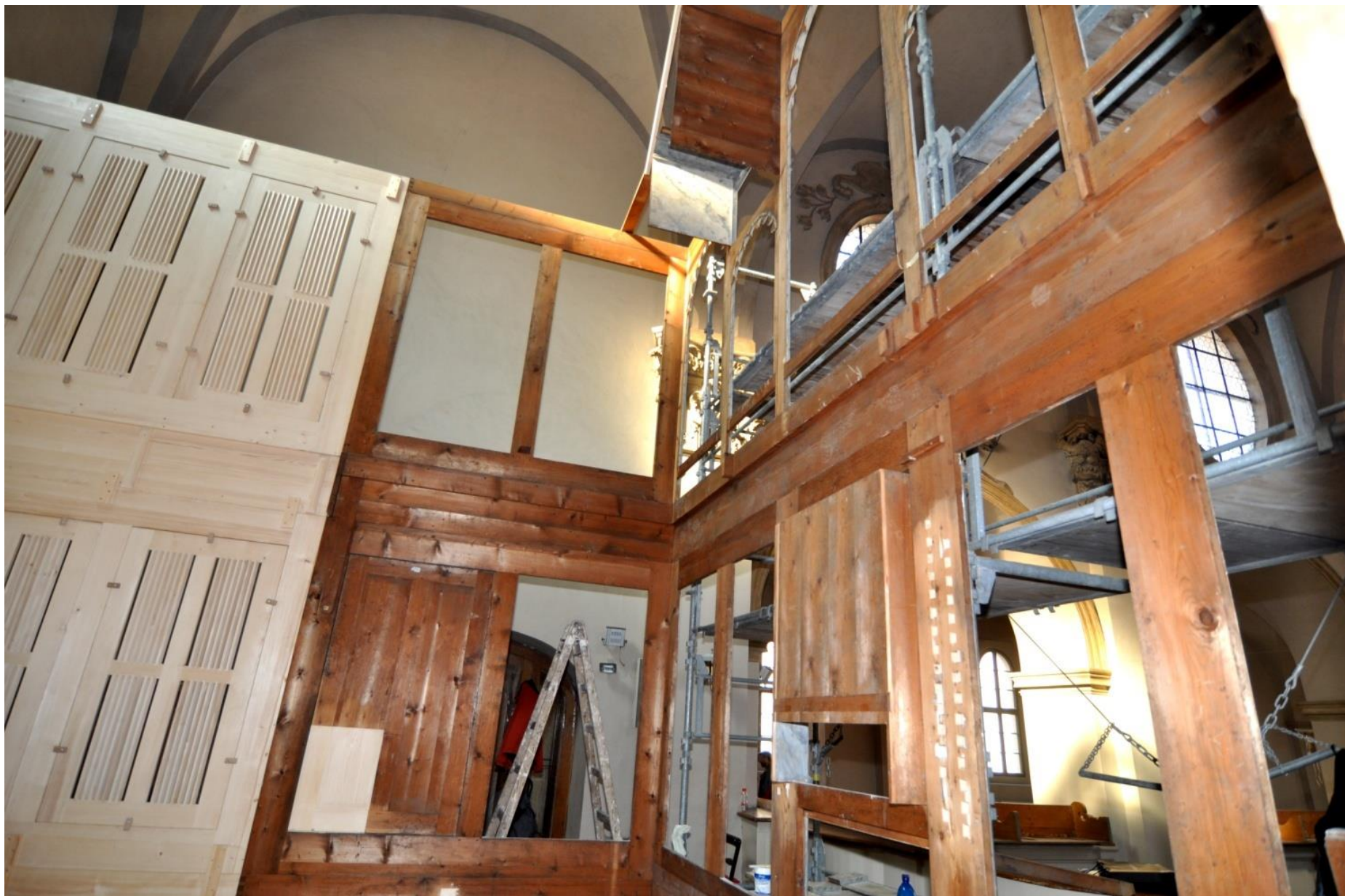
Detail rozšíření varhanní skříně.