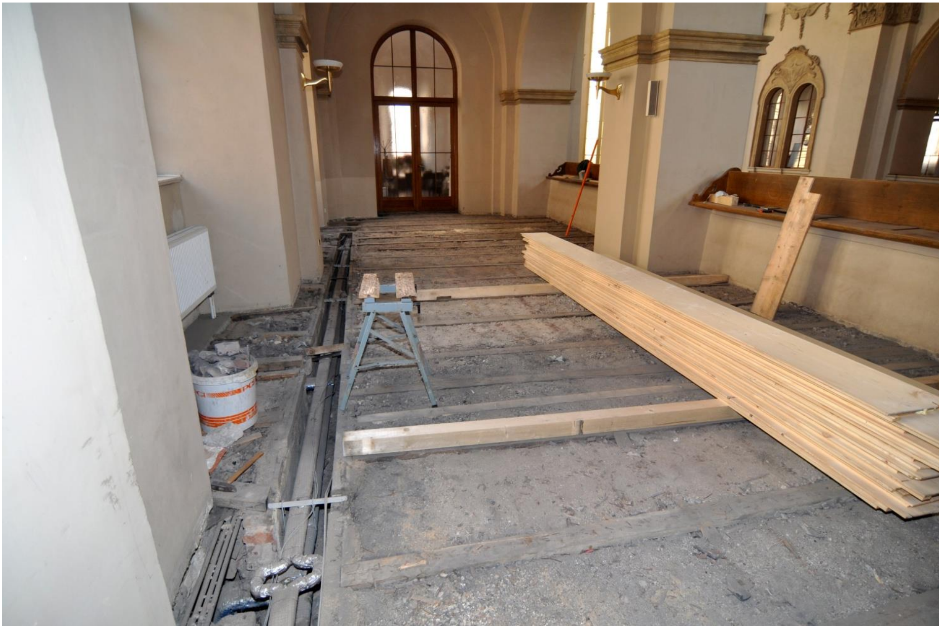
Oprava podlah na kůru.